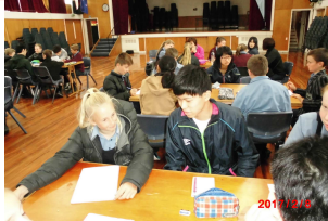
日本語の授業の様子