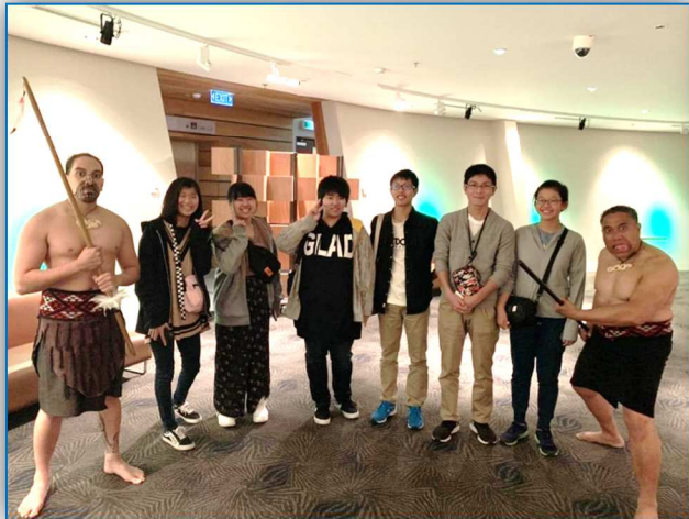
マオリショーを見学し、記念撮影も

そして、オークランド市内へ移動。市内中心部は地下鉄の工事がおこなわれており大渋滞。それぞれお土産を購入したり、ニュージーランドで一番大きな街並みを見て回ったりしていました。