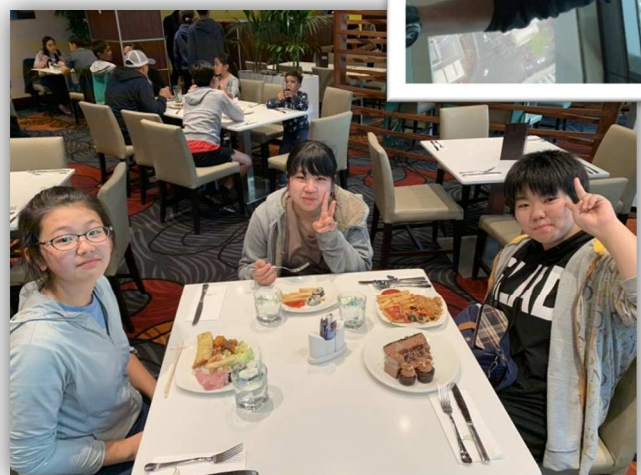
夕食は、ビュッフェ