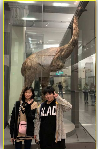
今は絶滅してしまった モアと。

夕食はスカイタワー内のビュッフェレストランで取りました。和食やデザートの種類も多く、思わず食べ過ぎてしまった生徒もいました。