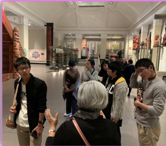
博物館の中を説明を聞きながら 見学しました。