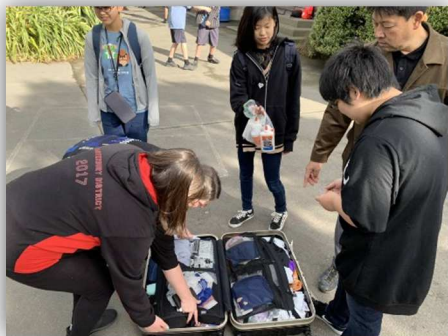
↑ 出発前に荷物の詰め直し