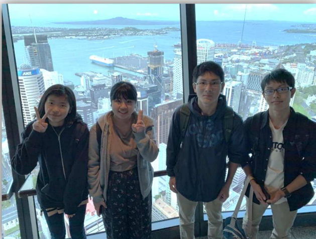
スカイタワーの上から