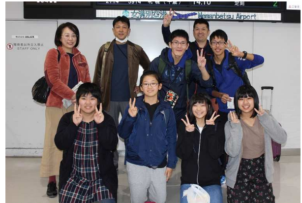
女満別空港出発前に

全ては予定通りのはずでしたが、ここから予定が狂い始めます。成田発の飛行機が約40分遅れでようやくニュージーランドに向けて出発しました。出発が大幅に遅れた分、夕食は21時30分ころになってしまいました。また、座席が後方だったため、夕食を選ぶことができなく、ビーフを頼みたかったのにフィッシュになってしまった生徒もいたようでした。