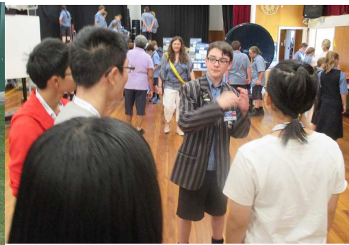
サイエンスショー見学

モーニングティーの時間では、講堂でサイエンスショーが行われていたので、参加させてもらうことに！小学6年生向けに行っていたショーも見学しましたが、元素記号や化学反応の実験など、かなりハイレベルで興味深い内容に生徒は釘付けになっていました。