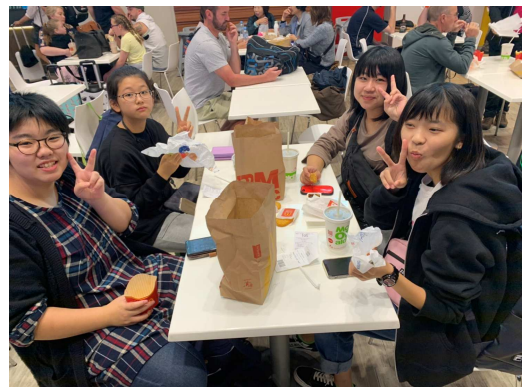
NZ 最初の食事はマック！