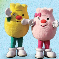
上湧別鬱金香公園 吉祥物 Tupit、Lip