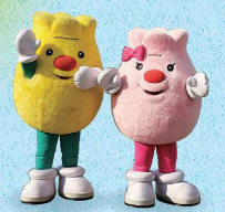
上涌别郁金香公园 卡通吉祥物 Tupit、Lip