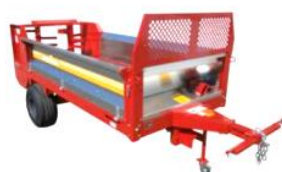
マニユアスプレッダ (堆肥散布機)