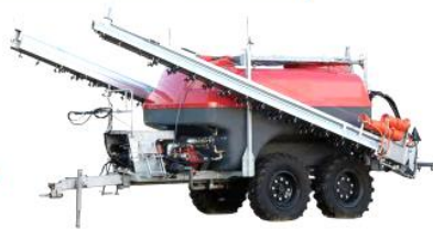
スプレーヤ (薬剤散布機)