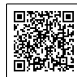
電子申請サービス

【提出先】①郵 送：〒099-6592 湧別町上湧別屯田市街地318番地 湧別町役場 総務課