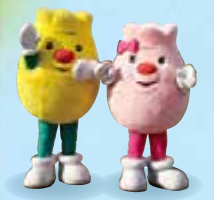
かみゆうべつチューリップ公園 イメージキャラクター チュービット・リップちゃん