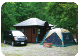
五鹿山キャンプ場 MAP 2-C

電源完備のオートサイトやログキャ ンピングがあり、チューリップの湯まで 約2kmと近いのが便利。予約制 でキャンプファイヤーも楽しめます。