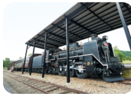
計呂地交通公園 MAP 3-E

三里浜キャンプ場にほど近い場所に位置し、公園内の展望台からはサロマ湖とオホーツク海を眺めることができます。冬は流水を間近に見られるポイントで、海岸に出て流水に直接触れることもできます。(流水の上には絶対に登らないでください)