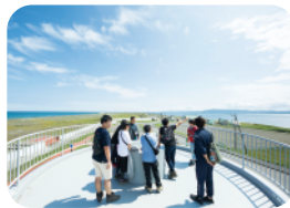
龍宮台展望公園 MAP 4-C

道内では1番、全国でも3番目に大きい湖。ここで獲れるホッカイシマエビや、養殖するホタテ・牡蠣などが美味しいことで有名。幻想的な絶景の夕日スポットとしても知られています。冬は凍結した湖面でのチカ釣りが人気です。