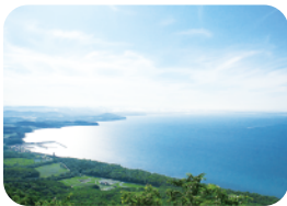
サロマ湖 MAP 3-C~4-E

道内では1番、全国でも3番目に大きい湖。ここで獲れるホッカイシマエビや、養殖するホタテ・牡蠣などが美味しいことで有名。幻想的な絶景の夕日スポットとしても知られています。冬は凍結した湖面でのチカ釣りが人気です。