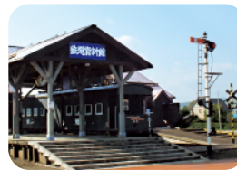
上湧別百年記念公園 鉄道モニュメント MAP 2-C

廃線となっているJR名寄線・湧網線の旧中湧別駅の一部を当時のまま保存・展示。タイムスリップしたような雰囲気味わえます。