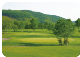
上湧別リバーサイドゴルフ場 MAP 1-D

湧別川の河川敷にある18ホール のゴルフ場。起伏が少なくフラッ トなコースは、ビギナーのチャレ ンジにも最適。低料金も魅力です。