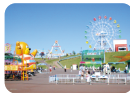
ファミリー愛ランドYOU(遊園地) MAP 3-D

日本最北端の観覧車からサロマ 湖を眺めることができます。併設 の駅には、レストランや地元特 産品を購入できる売店があります。