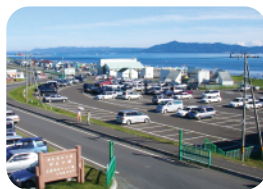
三里浜キャンプ場 MAP 4-C

コインランドリーやシャワー室完 備。電源があるバンガローは清潔 で快適です。満天の星空と、サロ マ湖畔に映る月の美しさは圧巻。