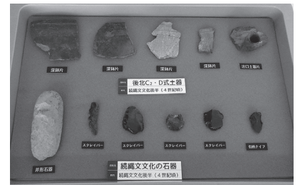
実際に出土した土器・石器

発掘調査の目的の一つは、竪穴住居跡の年代がいつ頃であるかを確認することでした。川西2遺跡では、続縄文(紀元前5世紀～紀元後6世紀)、オホーツク(5～9世紀)、擦文(7～12世紀)の3つの年代の竪穴住居跡があると推測されていたため、それぞれの年代が確認できそうな形状の竪穴住居跡から5か所が選定され、発掘調査が行われました。その結果、地層や出土した土器などの情報から、全てが擦文文化(10世紀頃)の住居跡であることが確認されました。そのことにより、川西2遺跡は擦文文化の大集落であった可能性が推測されます。