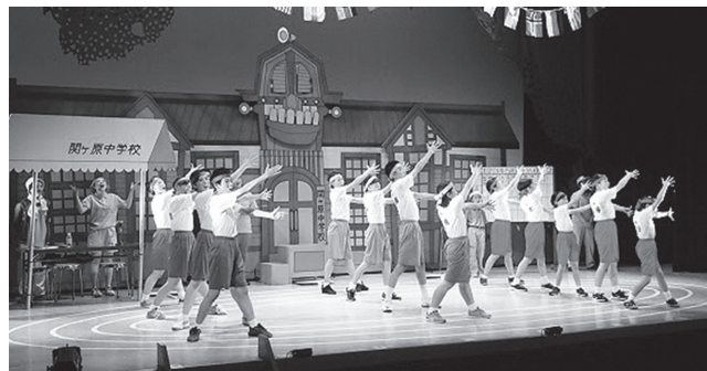
写真は埼玉県入間市公演の様子です