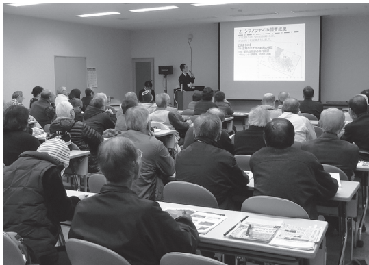
約50の方にご参加いただき、会場はぎっしり!

今年の報告会は、町民の方を中心に遠軽町・北見市などから約50名の方々にご参加いただき、改めて遺跡に対する興味関心の高さがうかがえるものとなりました。