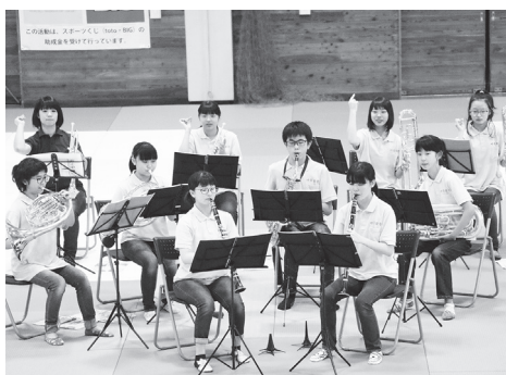
湧別中学校吹奏学部激励演奏