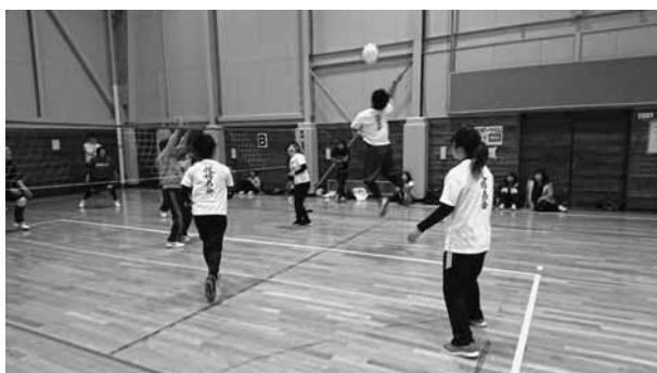
第13回町民イエローミニバレーボール大会

■第13回町民イエローミニバレーボール大会 期日：3月10日 場所：湧別総合体育館 主催：湧別バレーボール協会