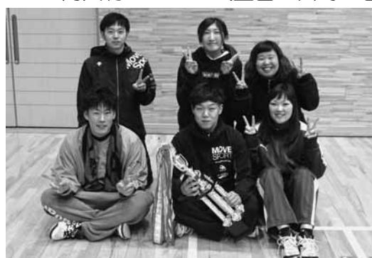
町民6人制バレーボール大会・男女混合の部優勝