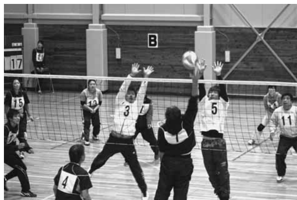
第3回ドリーム杯町民300歳バレーボール大会