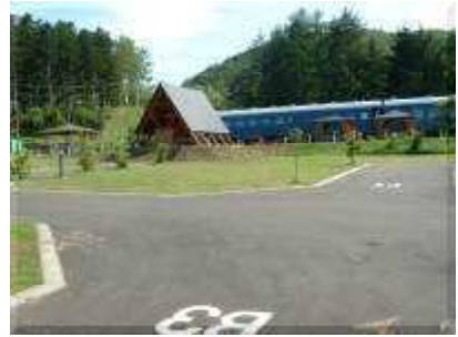
オートキャンプ(奥は炊事舎と列車)