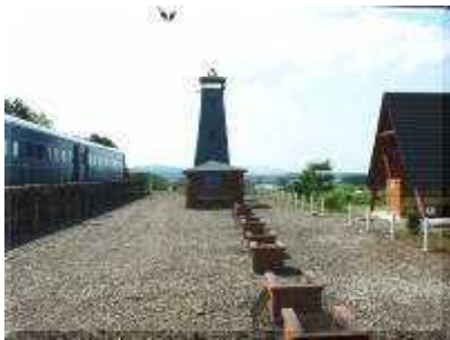
炊事舎と列車間にコンロ有