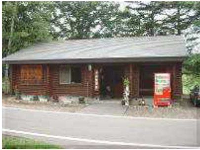
管理棟(受付はこちらで)