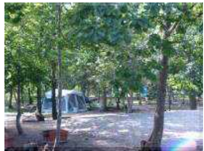
テントサイト(砂床)