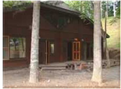
実習ロッジ(背面)コンロ2台有