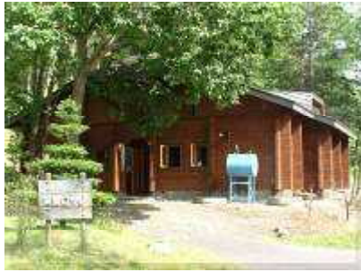
実習ロッジ(前面)入口です