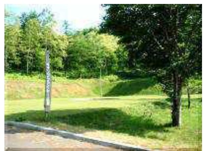
キャンプファイアー広場