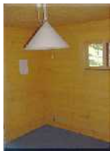
ログキャビン内(照明、コンセント有)