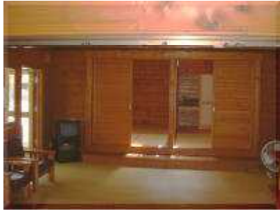
実習ロッジ内(奥に畳部屋)