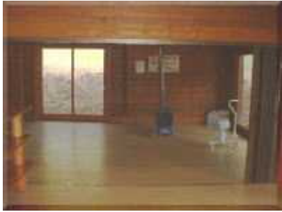
実習ロッジ内(薪ストーブ有)