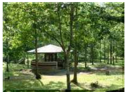
ログキャビン側の炊事舎