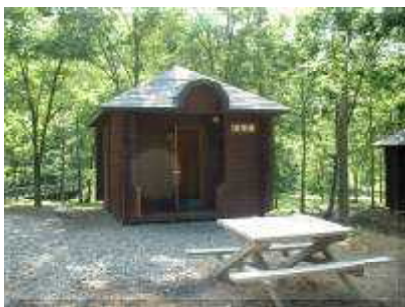
ログキャビン(テーブル、焼肉コンロ有)