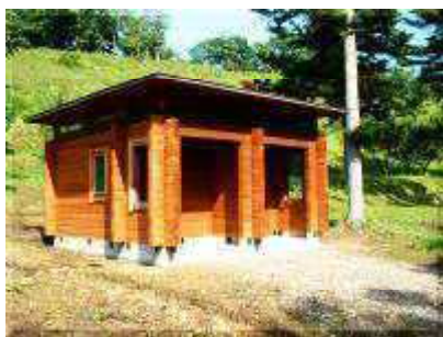
ログキャビン側トイレ